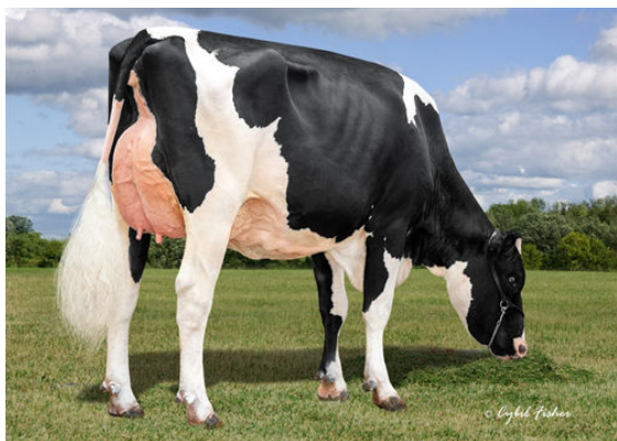
AOT POSITIVE HALLMARK GRANDDAM