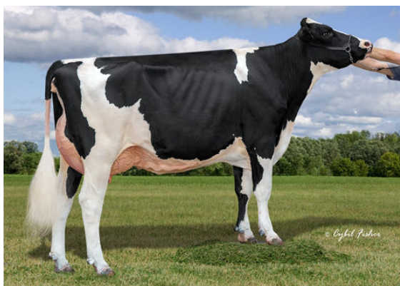
AOT POSITIVE HALLMARK GRANDDAM